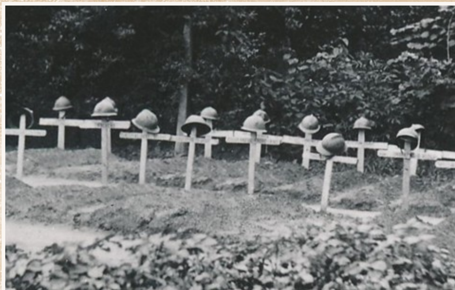
Vinkt - Voorlopig kerkhof Belgische gesneuvelde soldaten.