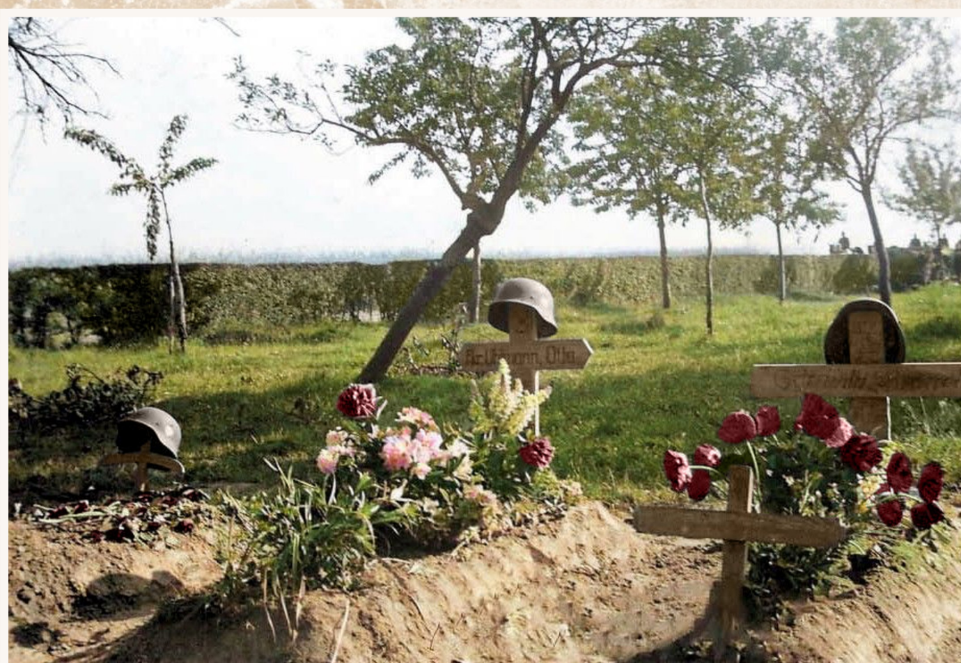
Enkele van de meer dan veertig graven op de boomgaard van de familie Notteboom in Meigem.

Gesneuvelde militairen kregen een eerste rustplaats in een veldgraf. Daarna werden ze overgebracht naar het Duits militair kerkhof in Vinkt in de Deinzestraat. In 1942 werden ze overgebracht naar het Duits militair kerkhof in Deinze en na de oorlog naar de Duitse militaire begraafplaats in Lommel.