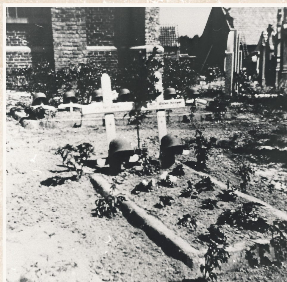
Zeven Duitse soldaten begraven op het kerkhof van Poesele.