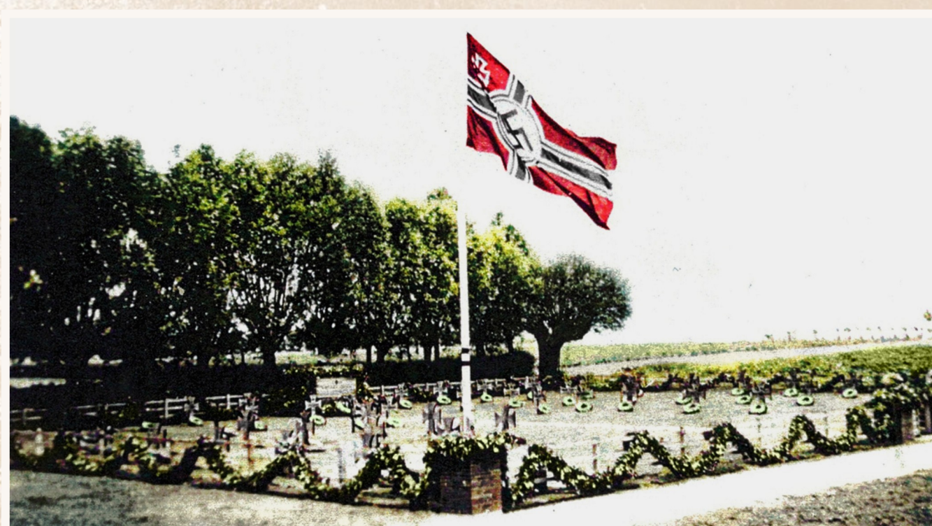
Het Duits militair kerkhof in Vinkt.