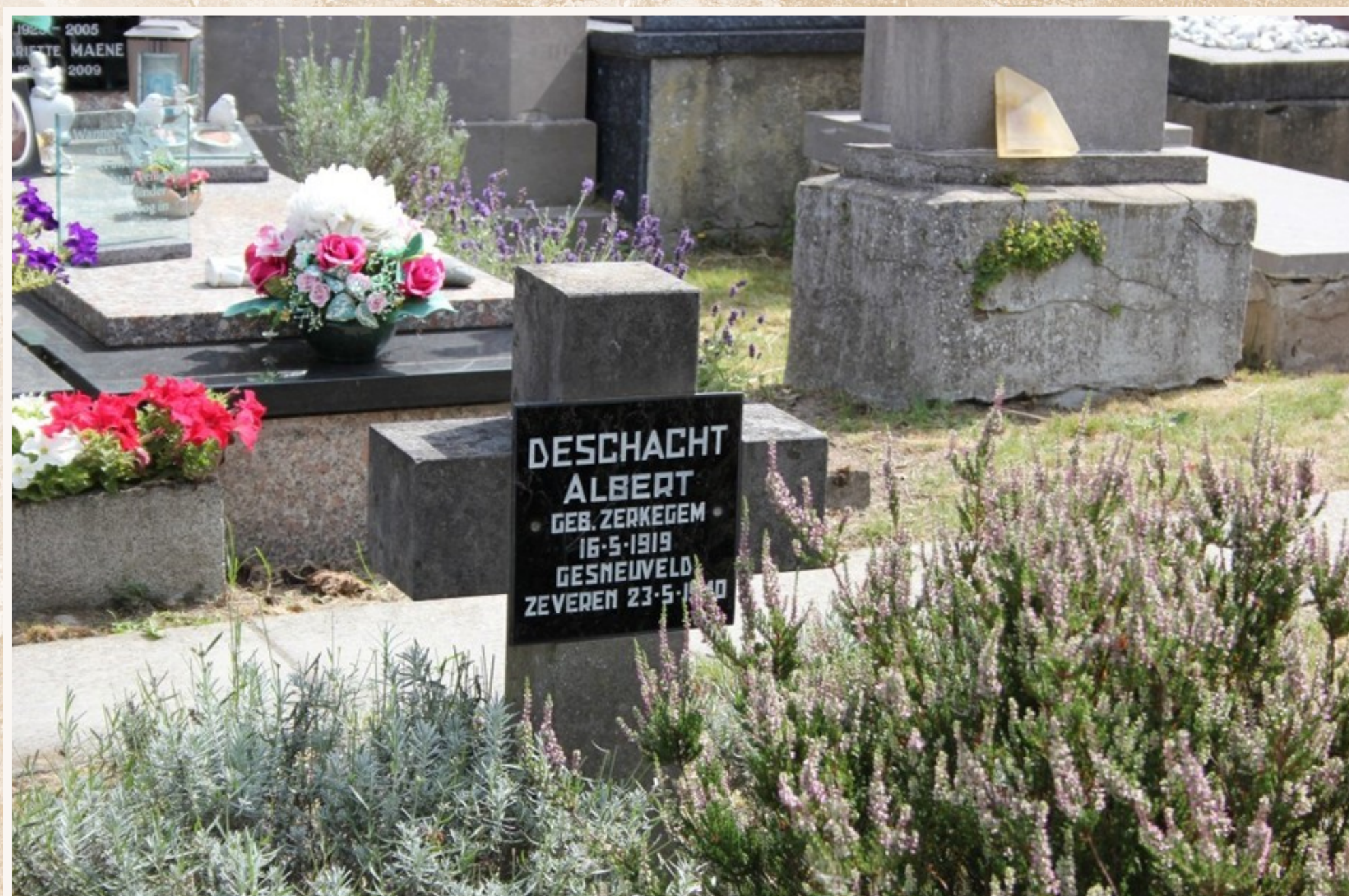
Graf van een van de 18 Belgische militairen die sneuvelden op het grondgebied van Zeveren: Albert Deschacht die er om het leven kwam bij een bombardement door Duitse Dorniers 17.

Belgische militairen die in mei 1940 op het grondgebied van Zeveren om het leven kwamen of er dodelijk gekwetst werden en elders overleden.