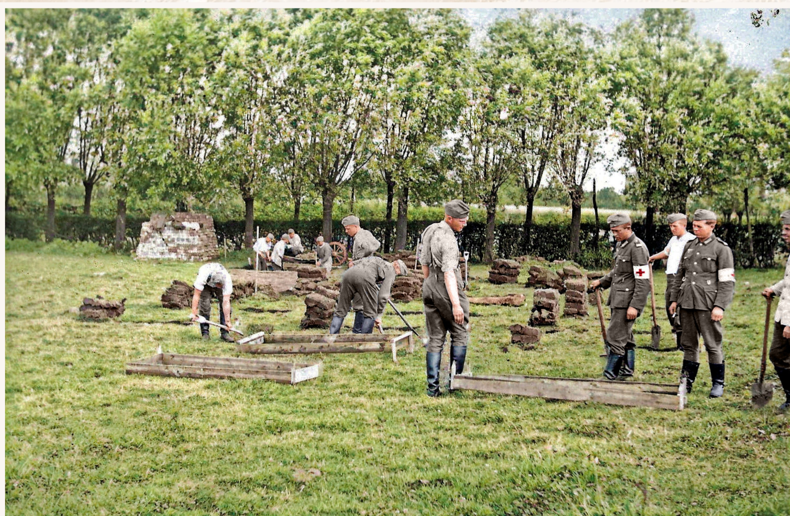
Aanleg van het Duits militair kerkhof in Vinkt.